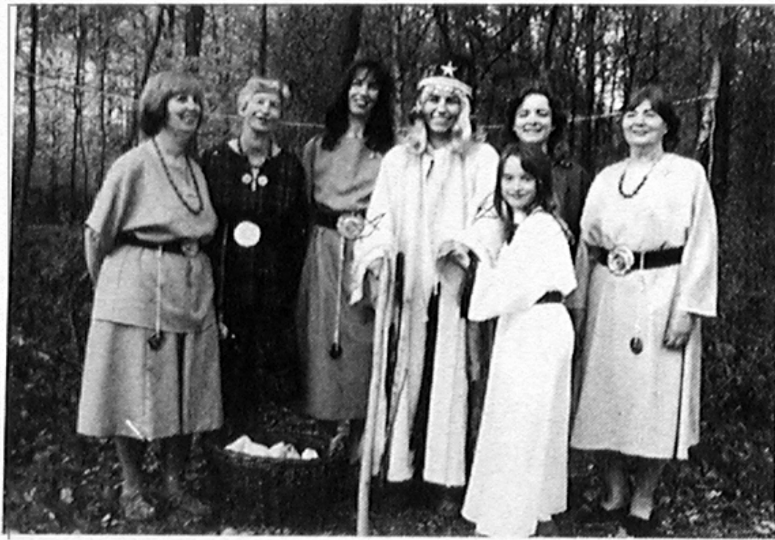
Hier ist nur ein Teil der 80köpfigen Truppe zu sehen